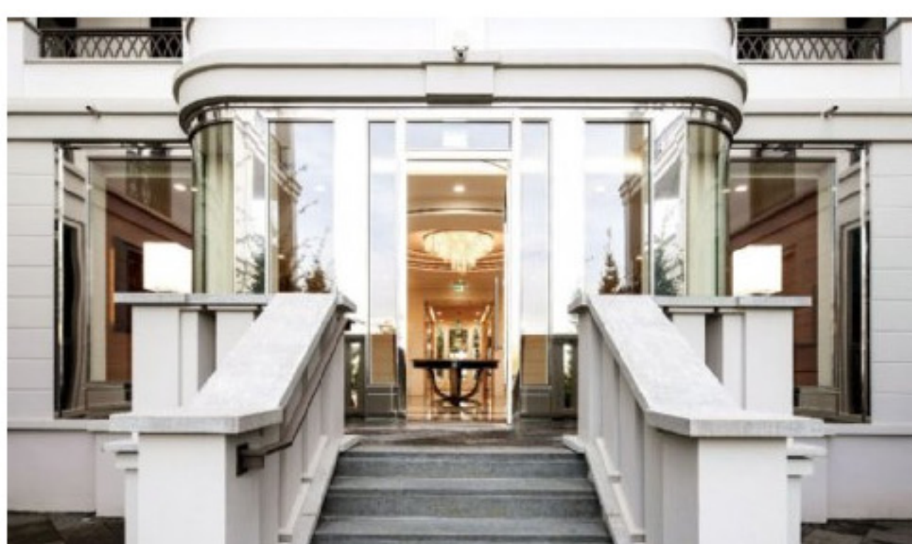
Das ist mal eine Haustür! Der Eingangsbereich des Hauses, in dem auch ein Doorman-Service arbeitet.

DÜSSELDORF – Wow, so müsste man wohnen! Vierte Etage in Oberkassel. 808 Quadratmeter Neubau. Bezugsfertig. Leider nicht ganz billig! 8,9 Millionen Euro soll das Penthouse mit elf Zimmern und 808 Quadratmetern kosten. Quadratmeterpreis über 11.000 Euro. Derzeit die teuerste Immobilie, die in Düsseldorf angeboten wird.