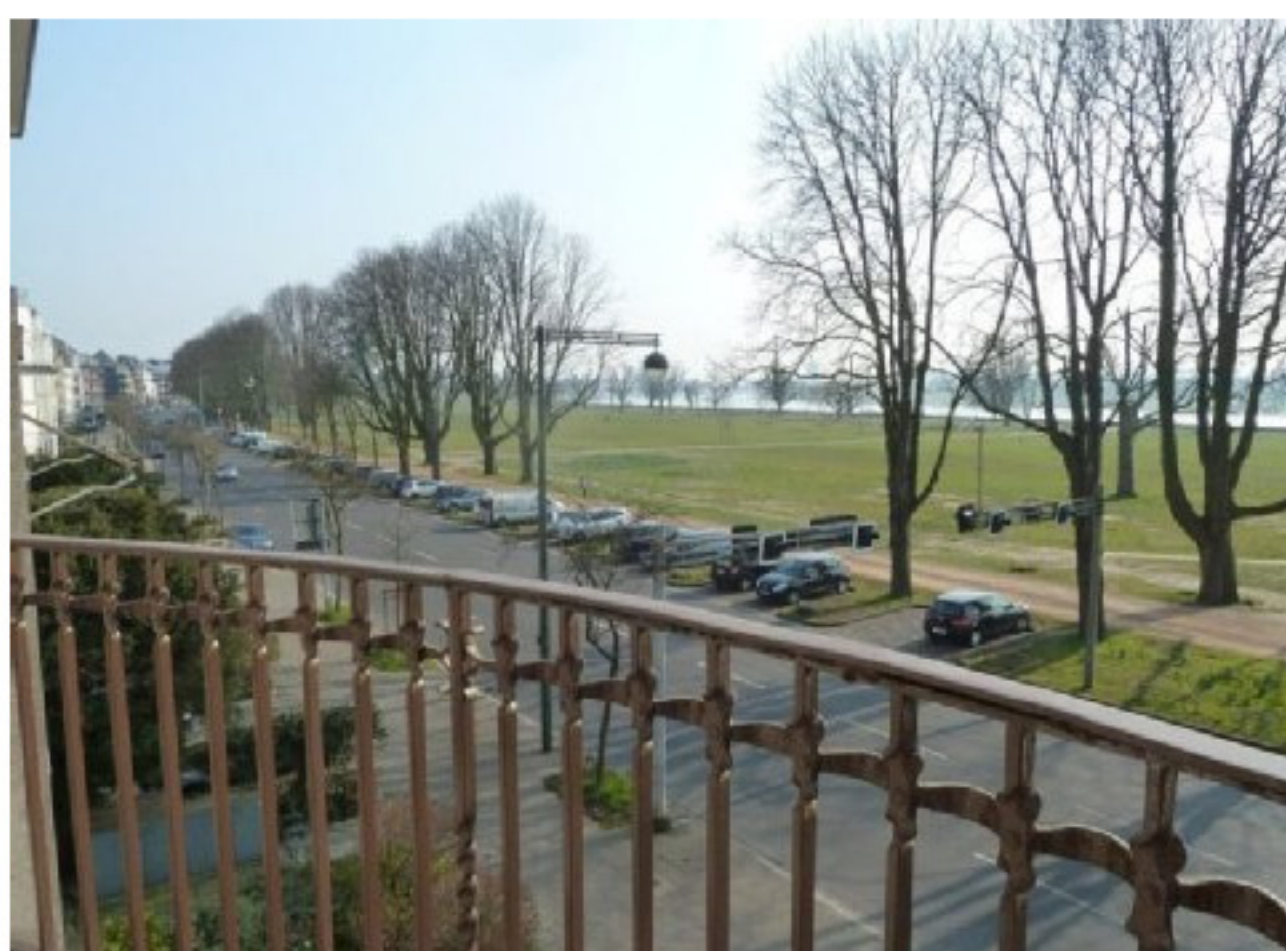
Ist das ein Ausblick! Foto aus dem Exposé der Golzheimer Gründerzeitvilla, die für 6,5 Millionen angeboten wird.

8,9 Millionen für Düsseldorfs teuerste Immobilie. Da wollen Sie sicher gern wissen, was auf Platz zwei und drei kommt: Wir haben recherchiert und fand noch zwei Mega-Knüller. 7,45 Millionen kostet eine Luxus-Villa mit Wellnessbereich auf Parkgrundstück in Hubbelrath. 11 Zimmer und 571 Quadratmeter Wohnfläche bietet Robiné Projektmanagement an.