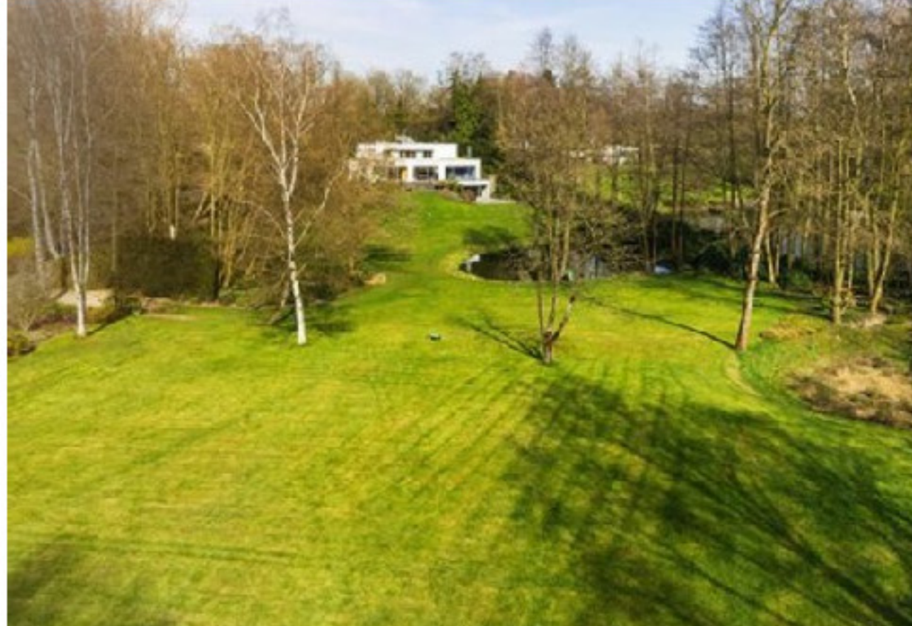
Kein Garten, sondern ein Park. Und dahinter ist die weiße Luxusvilla, die in Hubbelrath zum Verkauf steht. Preis: 7,45 Millionen Euro

8,9 Millionen für Düsseldorfs teuerste Immobilie. Da wollen Sie sicher gern wissen, was auf Platz zwei und drei kommt: Wir haben recherchiert und fand noch zwei Mega-Knüller. 7,45 Millionen kostet eine Luxus-Villa mit Wellnessbereich auf Parkgrundstück in Hubbelrath. 11 Zimmer und 571 Quadratmeter Wohnfläche bietet Robiné Projektmanagement an.